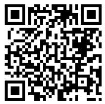
桃園市公立及非營利幼兒園 招生網