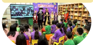
世界閱讀日-小裕老師說 故事. 網路分享躍上世界