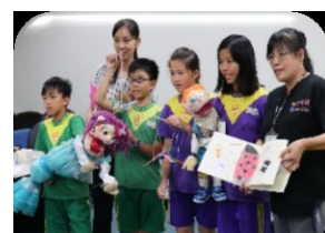
孩子自編故事演偶戲 記者會發表新戲碼