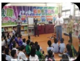
圖書館階梯教室~國際志 工爺爺說故事座無虛席