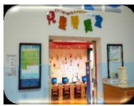
社區圖書館-兒覽室 也是提供閱讀好處所