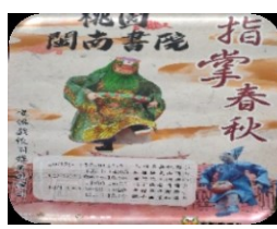
文化局~閩南書院常 與學校聯合書展