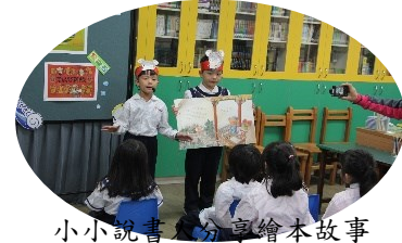
小小說書人 享繪本故事