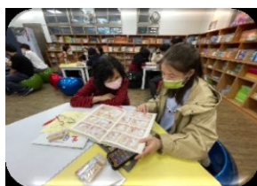
文山星光圖書館夜間開放 是親子共讀共學好時光