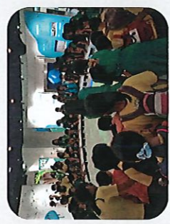
透過桃園地景光雕，認識桃園的自然環境、人文活動以及潛在危害。