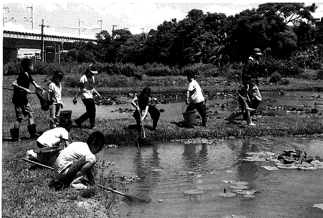
楊梅和平濕地食農教育體驗